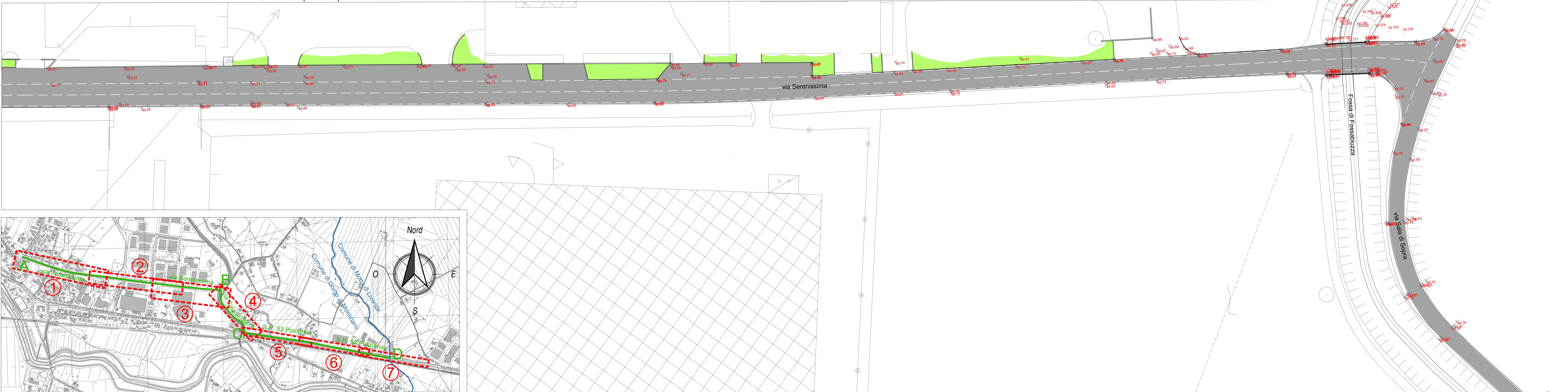
0 Keyplan Scala 1:10.000